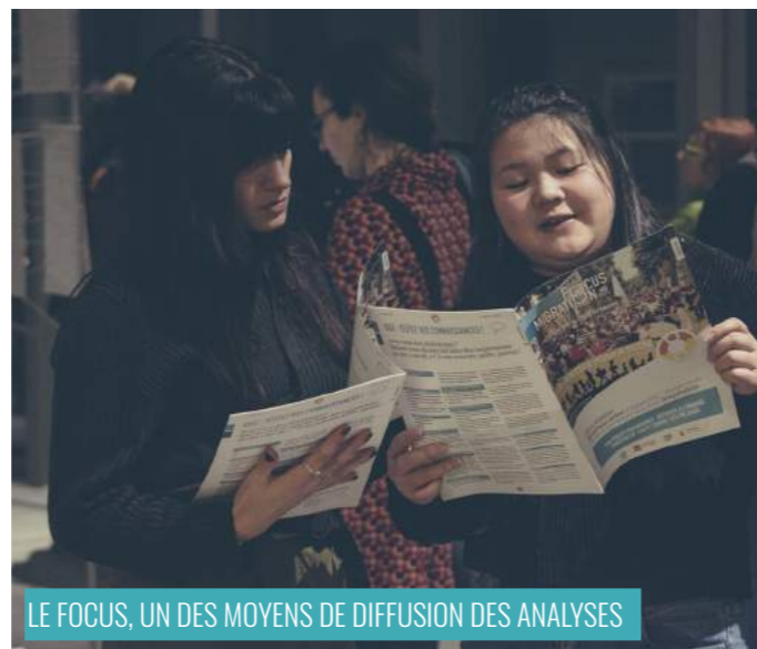
LE FOCUS, UN DES MOYENS DE DIFFUSION DES ANALYSES

Pas de transition sans co-construction et mise en commun de savoirs pluriels : le cas dans l'agriculture (Décembre 2019). Une réflexion suite au « café-philosophie » du 05/11/2019 : « Quels modèles de transition