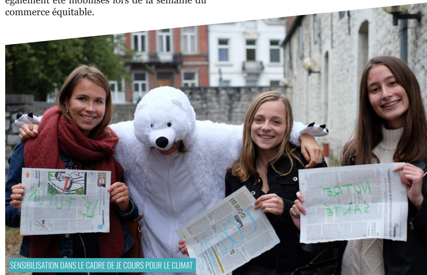
SENSIBILISATION DANS LE CADRE DE JE COURS POUR LE CLIMAT

Dans le cadre de la course « Je Cours pour le Climat », la FUCID a pu mobiliser de nombreux groupes relais : le KotéSport, l'Orgaz Musique, le KotéLocal et le Kotéjardin. Tous ont joué un rôle dans l'organisation de cet évènement. Le Kotélocal et le Kotéjardin et le DémocraKot ont également été mobilisés lors de la semaine du commerce équitable.