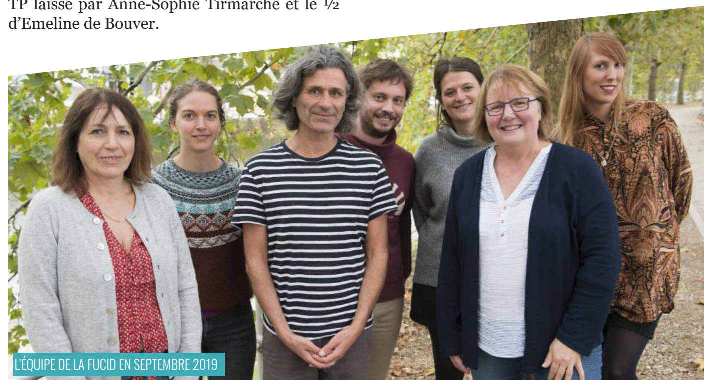
L'ÉQUIPE DE LA FUCID EN SEPTEMBRE 2019

Formation à l'animation de l'outil pédagogique Navatane le 9 mai 2019.