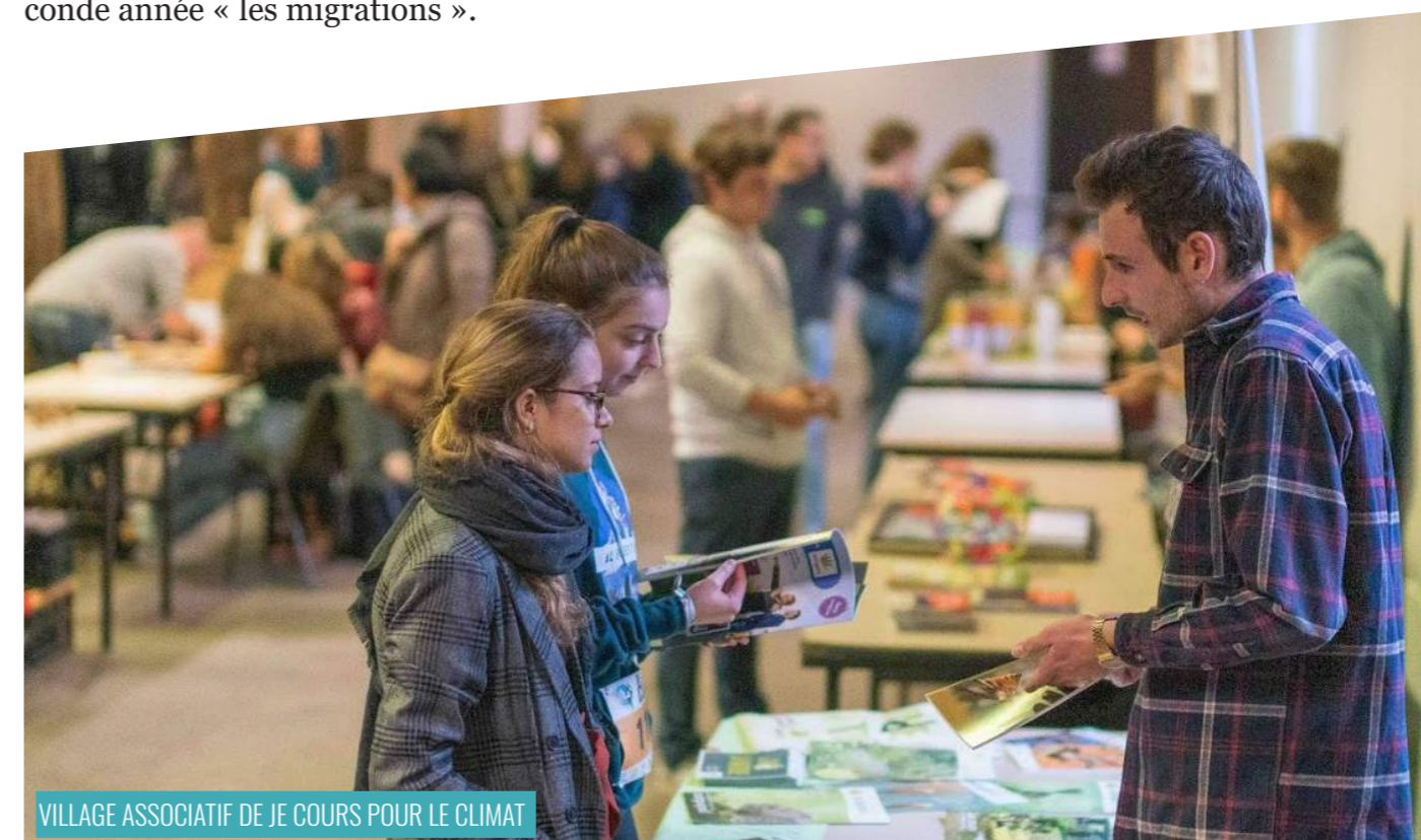
VILLAGE ASSOCIATIF DE JE COURS POUR LE CLIMAT

Ce colloque avait pour objectif de réfléchir à l'université comme laboratoire de la transition. À travers différentes tables rondes et interventions d'expert·e·s et d'acteur·trice·s, ce colloque a permis de débattre du rôle de l'université face aux défis écologiques, économiques et sociaux actuels. Il a également permis de promouvoir les échanges entre les différent·e·s acteur·trice·s de la communauté universitaire et de la société