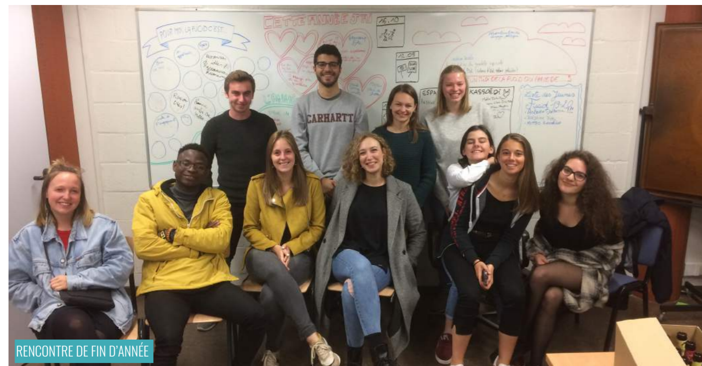
RENCONTRE DE FIN D'ANNÉE

Suite à cette campagne d'un quadrimestre, une rencontre de fin d'année a eu lieu avec le