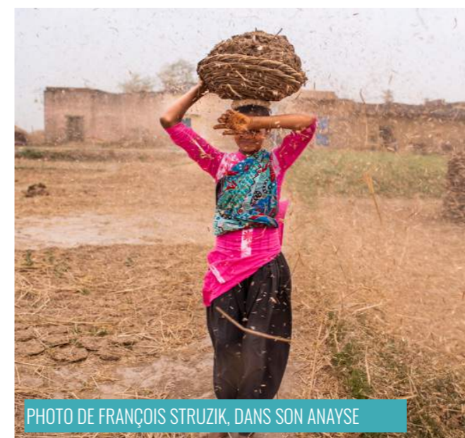
DANS SON ANALYSE