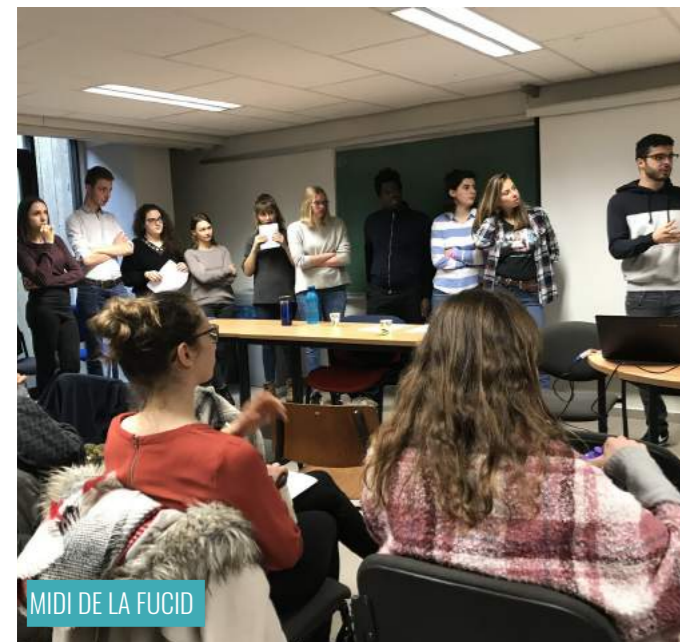
MIDI DE LA FUCID

Ce Midi a également été présenté en faculté de géographie le 29 avril ainsi que le 19 mars à l'Athénée Royale de Koekelberg devant des élèves de 5ème et 6ème.