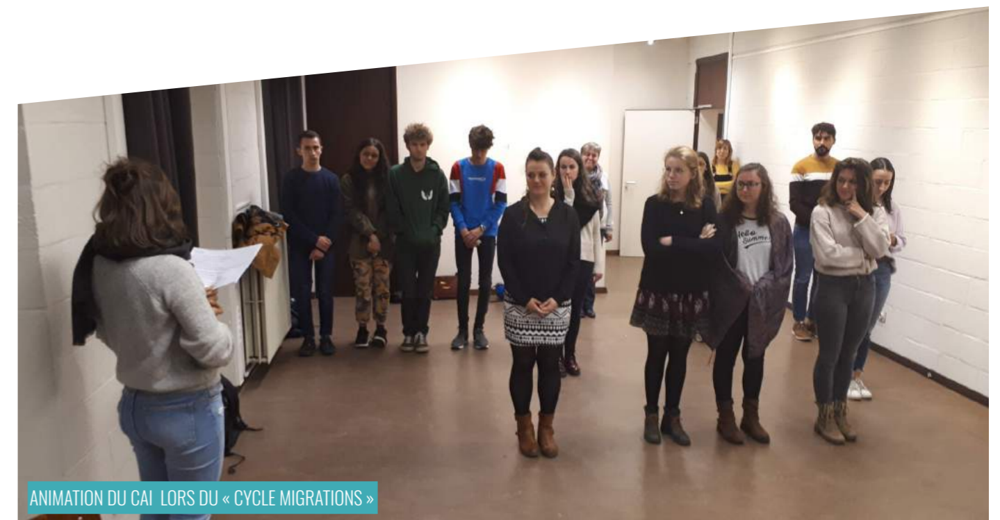
ANIMATION DU CAI LORS DU « CYCLE MIGRATIONS »